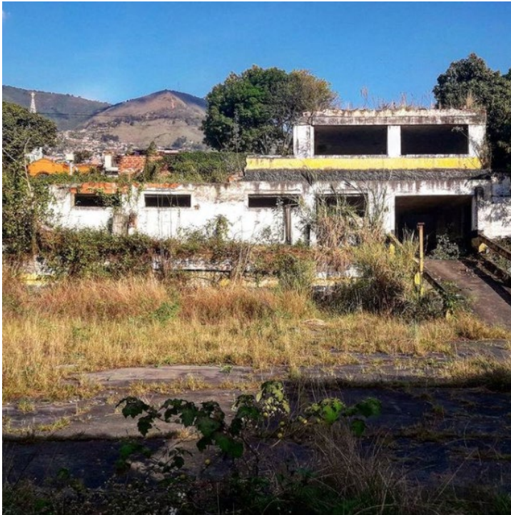
Lote para el Parque Prado, Medellín Prado Park Lot, Medellín