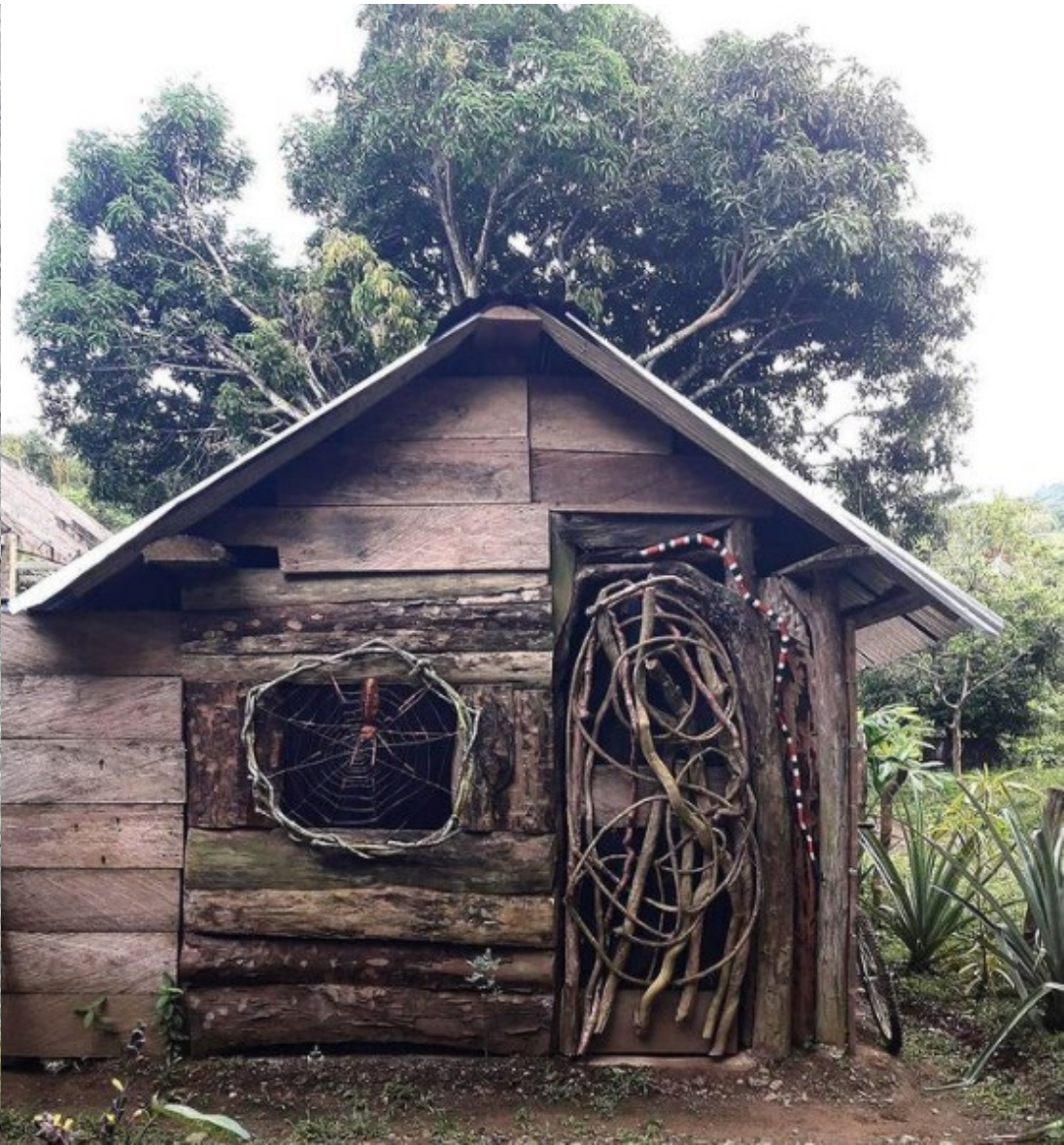
La Barra, Buenaventura, Valle del Cauca La Barra, Buenaventura, Valle del Cauca