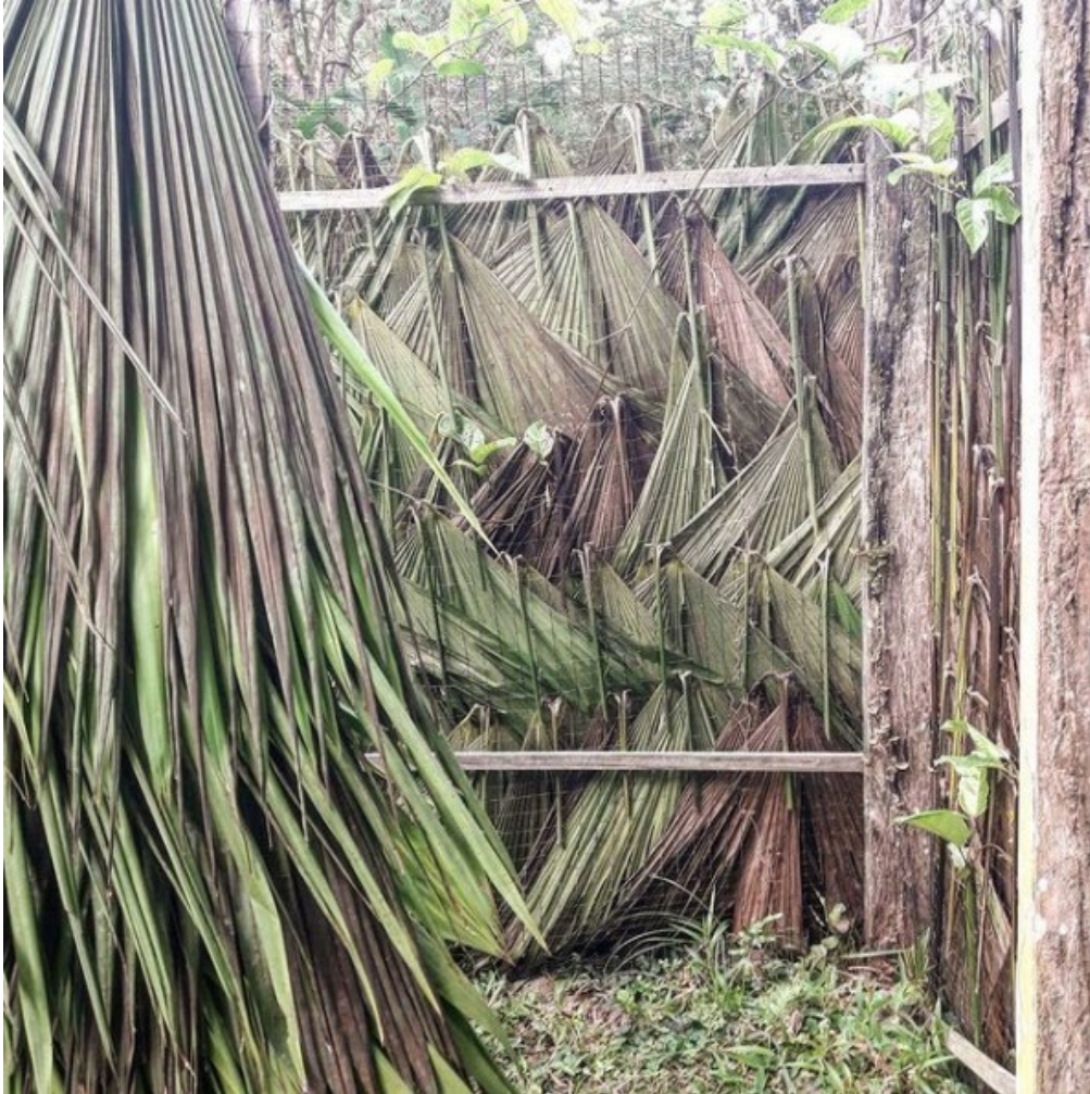
Cerramiento natural en La Barra, Valle del Cauca Natural fence in La Barra, Valle del Cauca