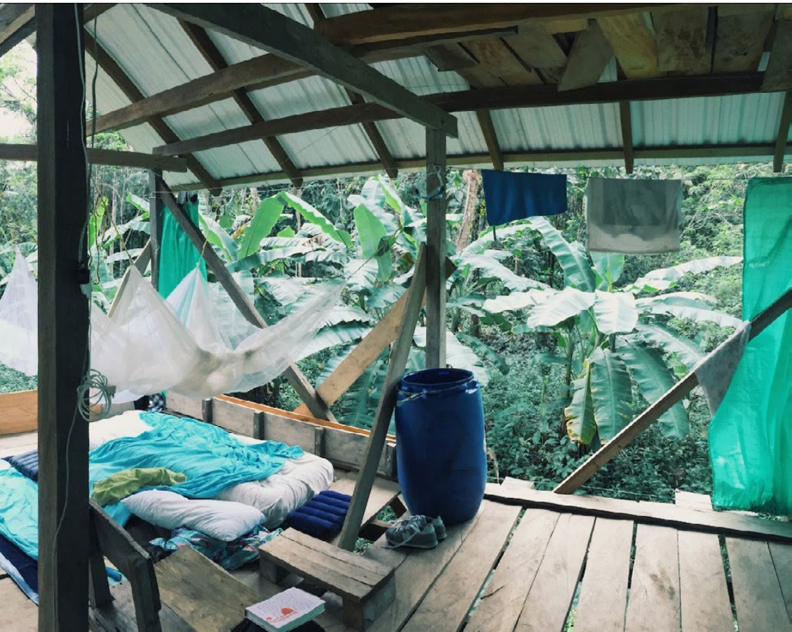
Casa en Arusí, Chocó House in Arusí, Chocó