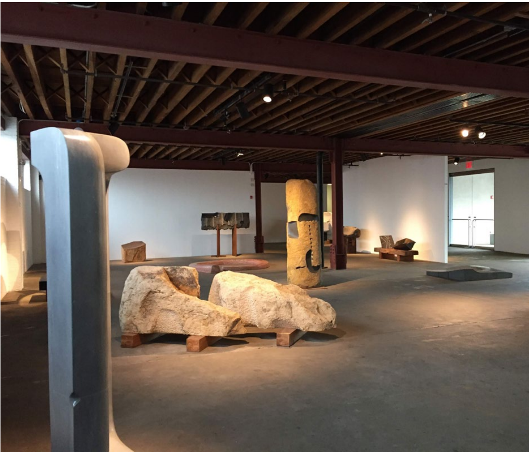
Museo Noguchi, Nueva York The Noguchi Museum, New York