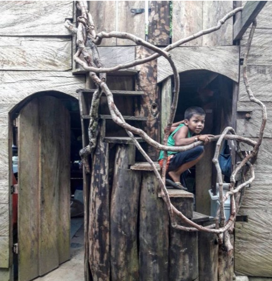
La Barra, Buenaventura, Valle del Cauca La Barra, Buenaventura, Valle del Cauca