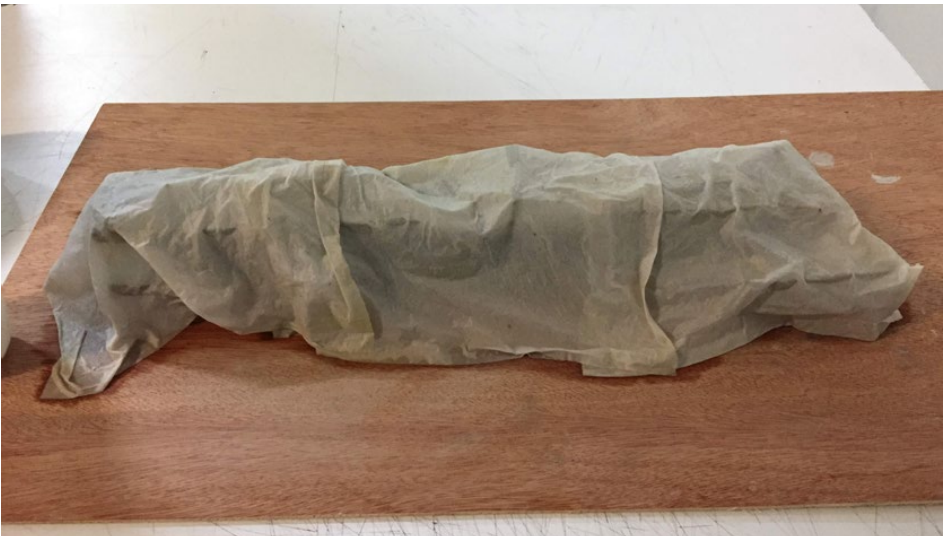
Método para conservar una maqueta de arcilla Method to preserve a clay model