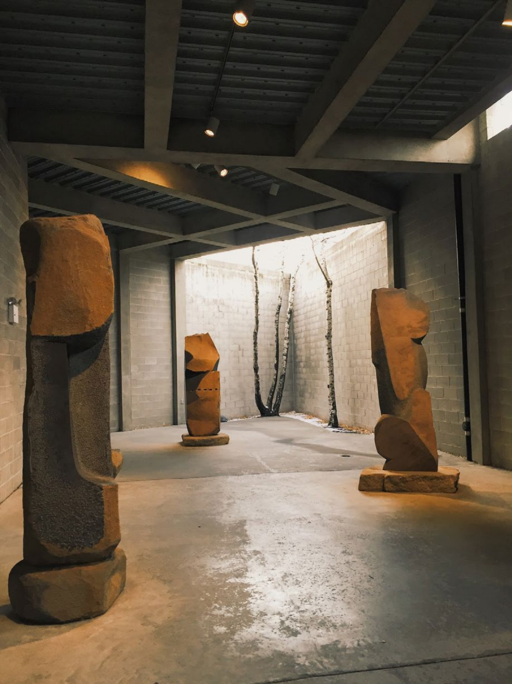
Museo Noguchi, Nueva York The Noguchi Museum, New York