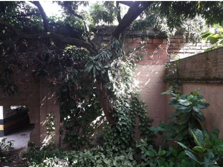
Lote para el Parque Prado, Medellín Prado Park Lot, Medellín