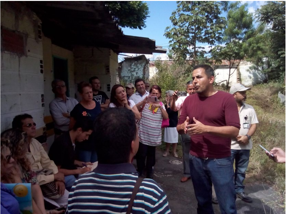
Socialización de los diseños del Parque Prado con la comunidad, Medellín Socialization of the Prado Park designs with the community, Medellín