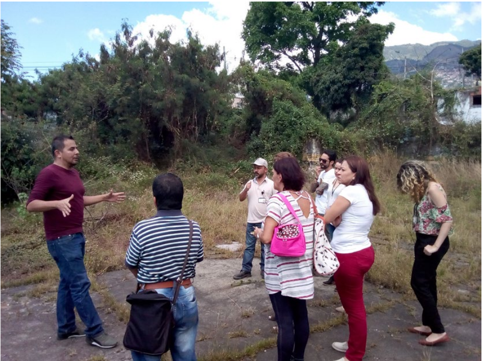
Socialización de los diseños del Parque Prado con la comunidad, Medellín Socialization of the Prado Park designs with the community, Medellín