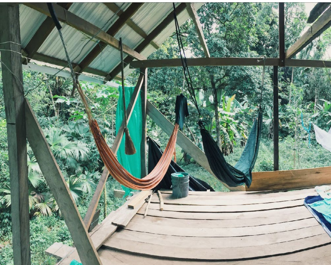
Casa en Arusí, Chocó House in Arusí, Chocó